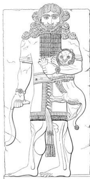
Figura 8. "Izdubah strangling a lion. From Khorsabad sculpture", 1876, George Smith (assyriologist), The Chaldean Account of Genesis .

Associações com deuses imortais e com o sol (Figura 9) fazem com que nosso processo existencial ganhe sentido ontológico e, por isso, coletivo. Jung (1986) expressa essa visão quando diz que: