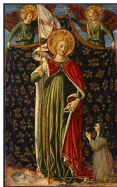
Figura 4. Saint Ursula with Two Angels and Donor, Benozzo Gozzoli, 1455-1456.

Esses símbolos surgem independentemente da época em que foram expressos. Existem inúmeras representações nas quais o poder divino no homem é representado pela cabeça, que, por sua vez, também é reconhecida como sede do pensamento, do intelecto e do psiquismo. Imagens de santos possuem auréolas ou cabeças envoltas por uma luz; nas produções artísticas da Idade Média, a cabeça é ilustrada como luz divina. O poder divino do homem habita a cabeça, como mostram as Figuras 4 e 5 (exemplos de pinturas medievais com cabeças destacadas com halos dourados, indicando seres espirituais, sagrados).