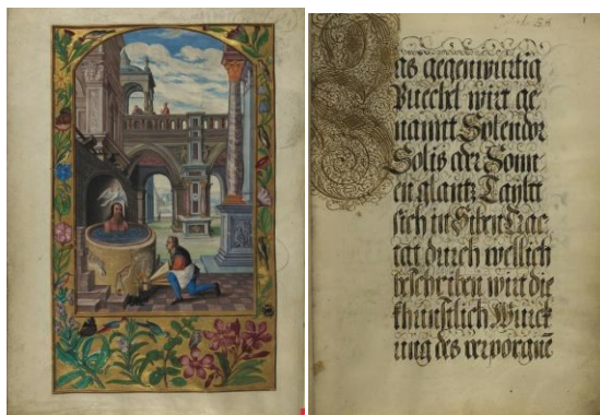
Figura 9. Iluminura e texto do “ Splendor Solis ”. Reproduzida de Plate XI – The seventh parable. Splendor Solis , 1582, http://www.chymist.com/Splendor%20solis.pdf

O homem de fato é mortal, mas há exceções, existem homens imortais, ou alguma coisa em nós que é imortal. Assim os deuses ou um Chidr ou um Comte de Saint-Germain são aquela parte nossa imortal que paira algures, inatingível. A comparação com o Sol sempre de novo nos mostra que a dinâmica dos deuses é energia psíquica; ela é a parte imortal, representando aquele elo através do qual o homem se sente integrado para sempre na continuidade da vida. (p. 186-187, OC V: 296)