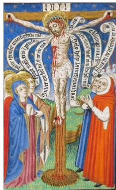
Figura 5. The Seven Last Words of Christ (detail), from a book of hours, Master of Sir John Fastolf, about 1430–40.

Como o códice é uma sequência de pensamentos, organizada e numerada no tempo, o tempo é, junto com o pensamento, parte de uma sequência que compõe as partes do livro. Dessa maneira, podemos compreender que o livro reúne não apenas uma sequência de ideias como também o tempo em si, que é uma indicação alquímica, como podemos ver em Jung (1994) que extrai do Liber Quattorum uma importante informação para a “grande transformação” se dar: