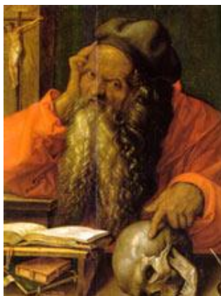
Figura 3. São Jerônimo, Albrecht Dürer, 1521.

Esses símbolos surgem independentemente da época em que foram expressos. Existem inúmeras representações nas quais o poder divino no homem é representado pela cabeça, que, por sua vez, também é reconhecida como sede do pensamento, do intelecto e do psiquismo. Imagens de santos possuem auréolas ou cabeças envoltas por uma luz; nas produções artísticas da Idade Média, a cabeça é ilustrada como luz divina. O poder divino do homem habita a cabeça, como mostram as Figuras 4 e 5 (exemplos de pinturas medievais com cabeças destacadas com halos dourados, indicando seres espirituais, sagrados).