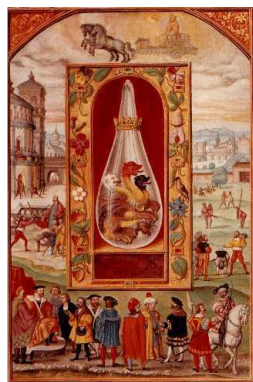
Figura 7. Iluminura alquímica: cabeças de dragão indicando albedo, rubedo e nigredo. Reproduzida de Plate XV- The fourth treatise, fourthly. Splendor Solis, 1582, http://www.chymist.com/Splendor%20solis.pdf .

Jung estava à procura de sua própria linguagem, oscilando entre sua mente intuitiva e sua mente racional, e escolheu utilizar recursos da pintura da Arte Medieval, como a caligrafia gótica e o alemão medieval. Nessa busca bastante elaborada, ele se encontrou com seu próprio mito pessoal, representado pelo herói mitológico Izdubar, personagem que aparece em várias cenas do livro, trajando uma roupa listrada de azul e branco. Assim como os heróis da Antiguidade, Jung tinha imenso respeito e temor pelas figuras primitivas, mitológicas. Dessa forma, ele conseguiu atingir mais do que uma linguagem própria: alcançou uma cosmologia pessoal, como Shamdasani (2010) indica em sua introdução ao “Livro vermelho”.